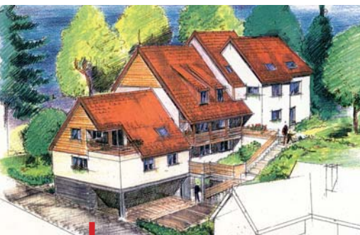
Résidence "La Villa des Sapins bleus" à Ottrott